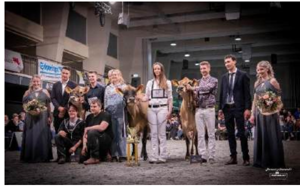
Die Intermediate Champions