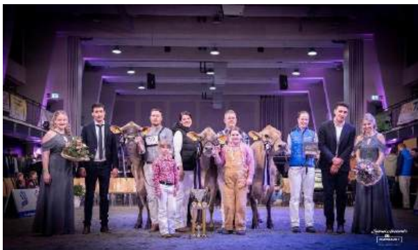
Die Senior Champions