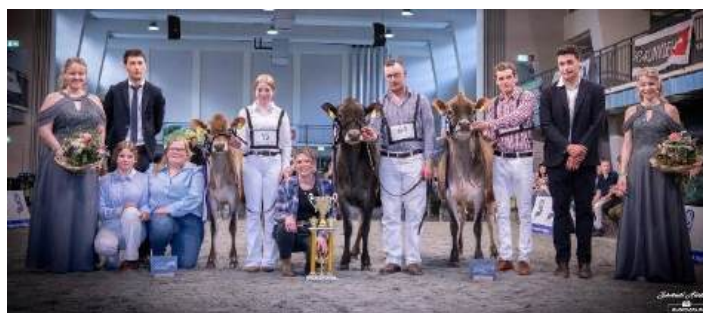
Die Rinder Champions